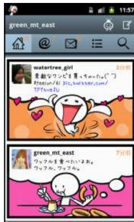
(Android版開発中の画面です)

弊社は今後、海外も含めてAndroid市場を強く意識した製品、サービス等の展開を行います。