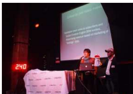
【SF NewTech JapanNight】